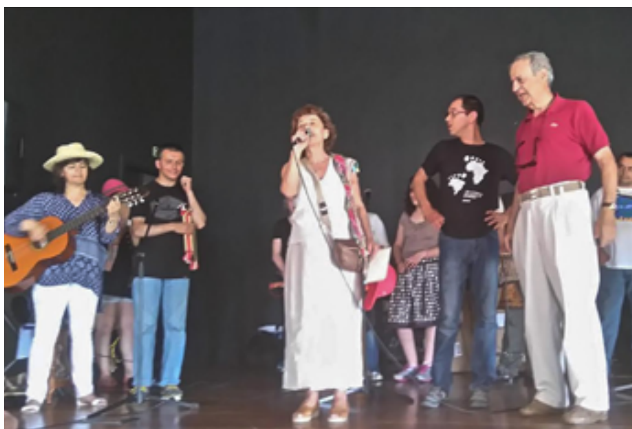
Entrega dos prémios "Chapéu Solidário", uma iniciativa da Fundação Vox Populi

O futuro pertence a Deus. Mas eu acredito que a ASTA do futuro continuará a ser a organização forte e dinâmica que é hoje. As bases que alicerçarão esse futuro serão uma carta constitutiva, sólida e blindada, e uma carta de princípios que permita preservar, de uma forma eficiente e, ao mesmo tempo, simples e clara, a visão da mulher que a fundou. •