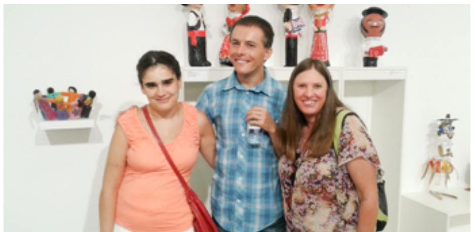
▲ Companheiros da ASTA na entrega de prémios - Fundação Manuel António da Mota Companheiros da ASTA a criar a obra “Primavera” ▶