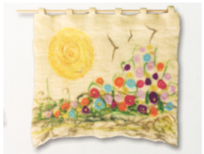
A obra “Primavera”:

As obras foram expostas durante cerca de um mês e avaliadas por um júri de diversas áreas de opinião. O júri