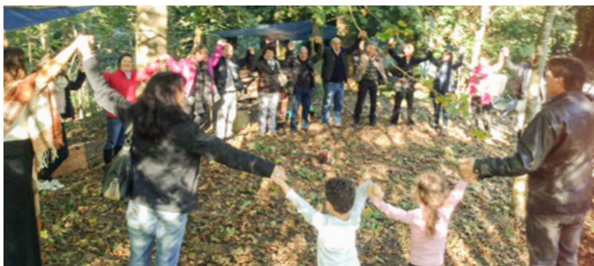
A Roda da ASTA recriada em Estrasburgo