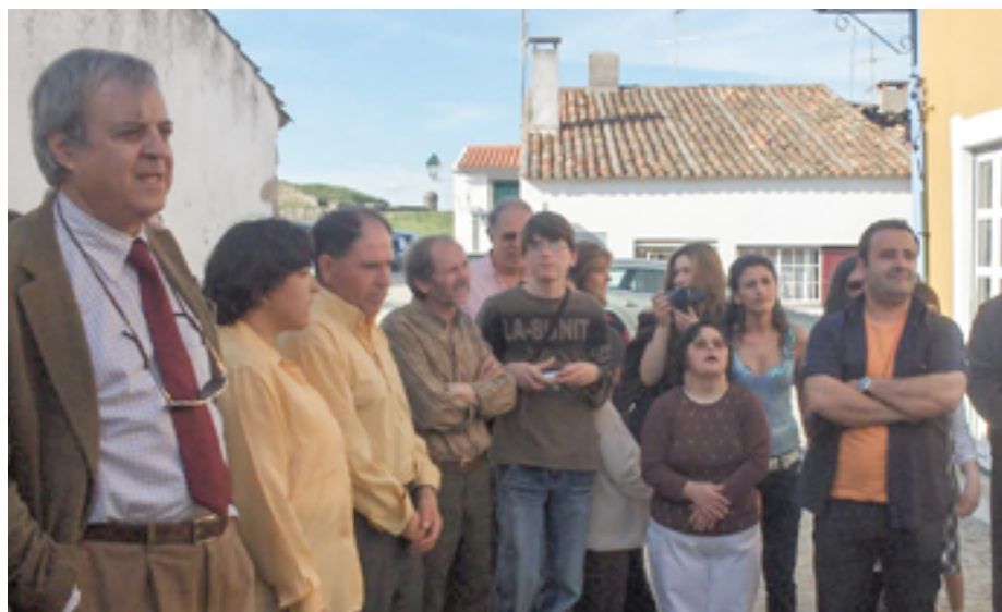
Entrega à ASTA das casas “Canto Com Alma”, em Almeida

É um sonhador e um visionário. Vive a angústia de quem procura respostas e nem sempre as encontra. Considera-se um homem feliz porque faz o que gosta e gosta do que faz.