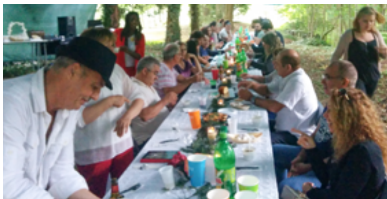
O decorrer de almoço