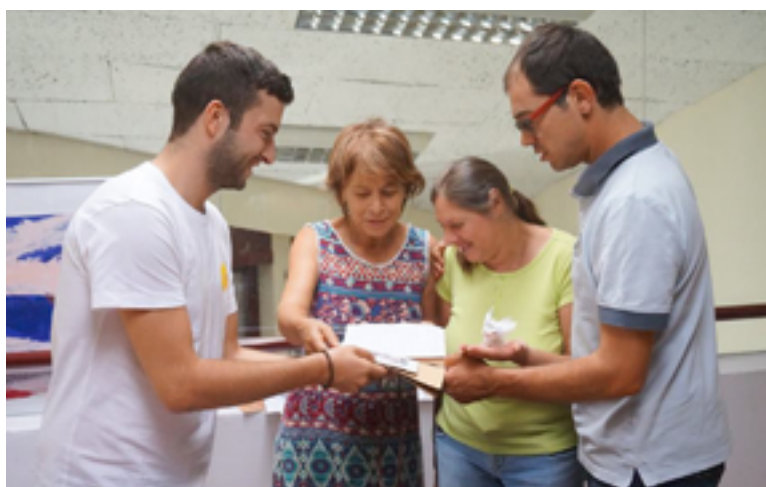
Visita à ASTA de elementos da comunidade portuguesa para entrega do donativo.

Para terminar, no passado mês de agosto, um grupo de portugueses residentes e com fortes ligações à região de Estrasburgo deslocou-se ao concelho de Almeida para conhecer in loco a ASTA. Após a visita, o grupo deixou a seguinte mensagem: “Aproveitamos para partilhar que ficamos na nossa memória os sorrisos, as trocas, as partilhas e a vossa generosidade,